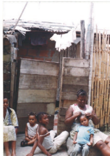
Escenas niños, jóvenes y adultos, barrio Sardi, oriente de Cali