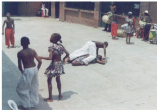
Danzas folclóricas del Centro de Desarrollo Comunitario del barrio Charco Azul, oriente de Cali.