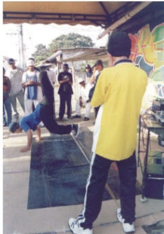
En barrios como Charco Azul, los jóvenes improvisan escenarios en las calles para exhibir sus mejores pasos de break dance, oriente de Cali.