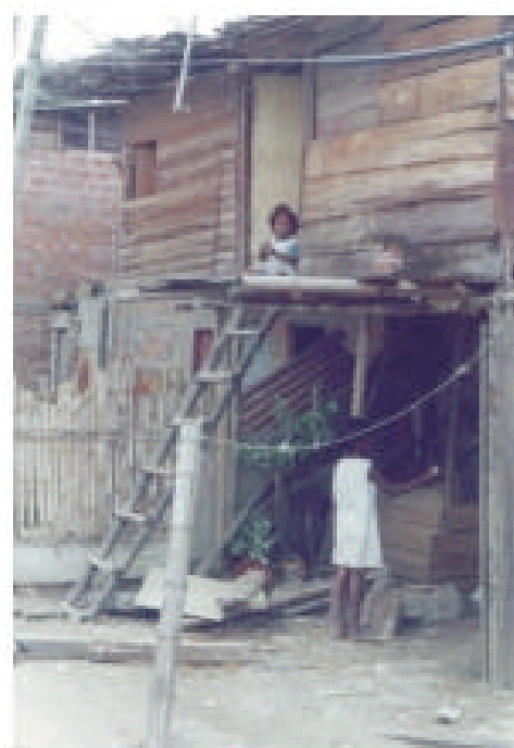
Vista panorámica y fachada de casas en el barrio Sardi, oriente de Cali.