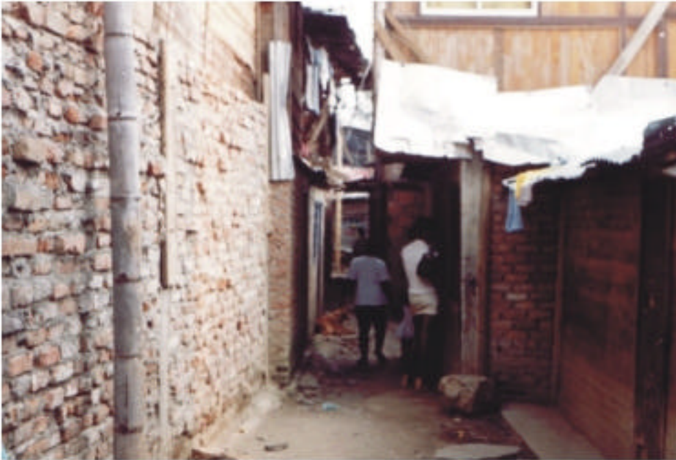
Callejones, barrio Sardi, oriente de Cali.