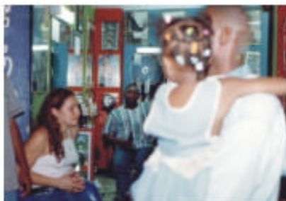
Escenas de un día de trabajo en la peluquería afro “Africa”, barrio Villa del Lago, oriente de Cali.