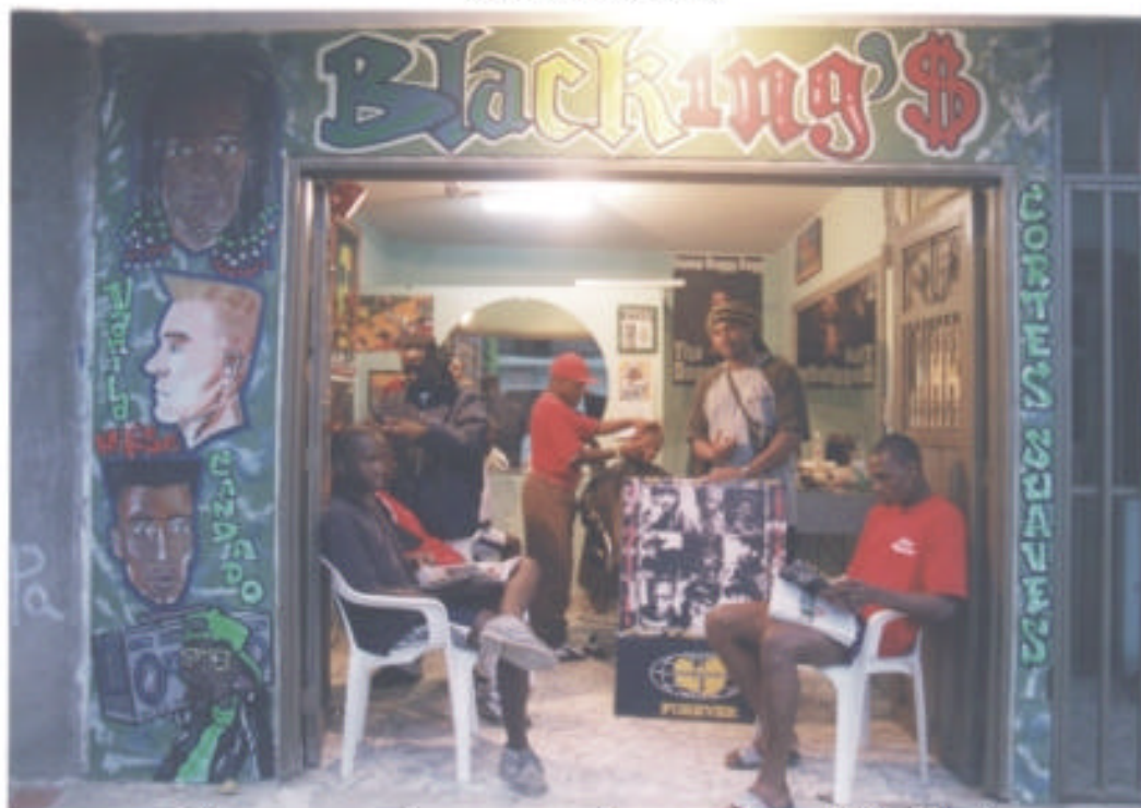
Clientes esperando turno para el corte, peluquería Blacking '$, barrio El Vergel, oriente de Cali.