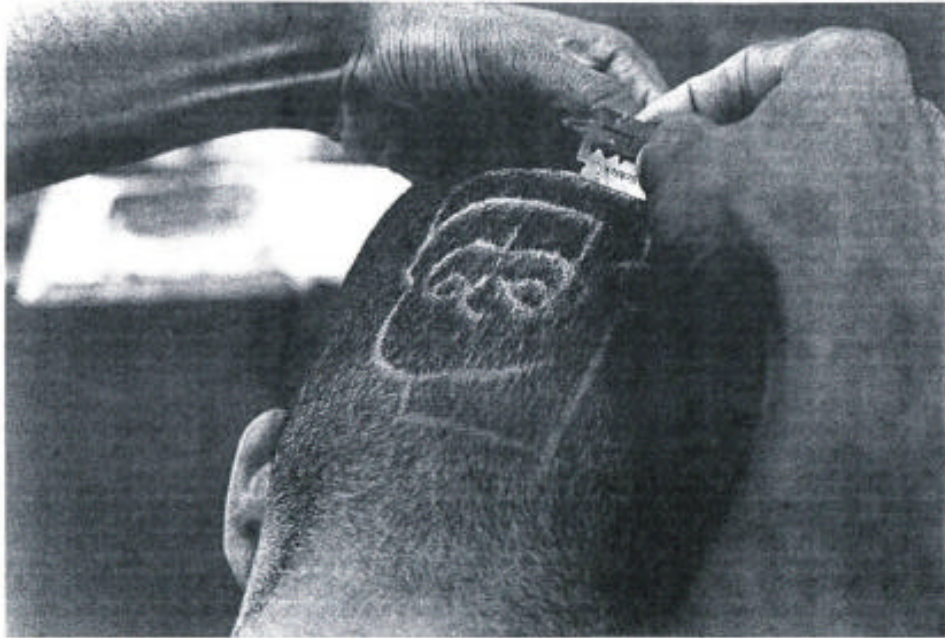
Corte de cabello con imagen de Bart Simpson, peluquería "Africa", barrio Villa del Lago, oriente de Cali.