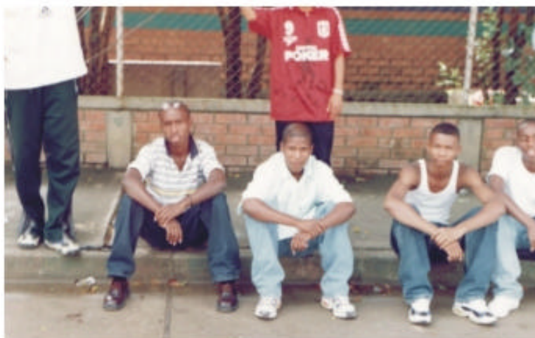
Escenas de jóvenes negros-mulatos en Charco Azul.