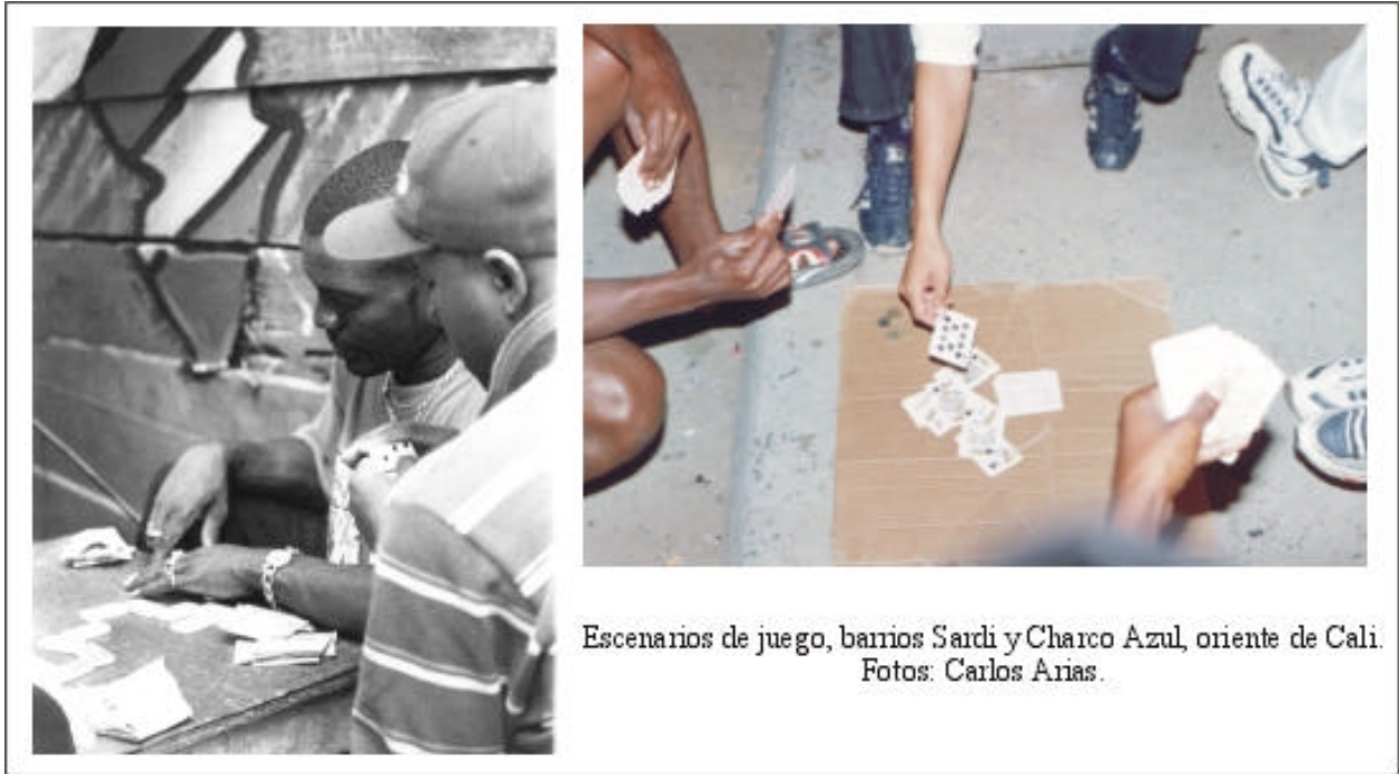
Escenarios de juego, barrios Sardi y Charco Azul, oriente de Cali.

barrio, así no tenga mucho dinero pero con un buen trabajo y una buena educación, que la saque a vivir fuera (Whyte, op.cit: 299). Es decir, en un lenguaje contemporáneo de las ciencias sociales, el grupo de pares en los espacios barriales populares es profundamente desigual a nivel de género –podríamos añadir, excluye a las mujeres- y esto pareciera una constante que se mantiene en las sociedades urbanas modernas (como lo observó detalladamente este autor) y contemporáneas. Aunque este aspecto no es un hallazgo nuevo, en nuestro caso sí es necesario remarcarlo aquí para efectos del análisis de los datos construidos a lo largo de la descripción en este capítulo y en los siguientes.