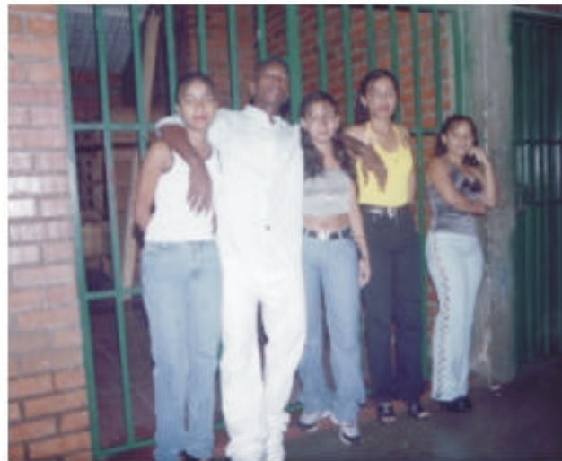
En los momentos previos a la presentación, los jóvenes (hombres-mujeres), esperan en las afueras del Centro de Desarrollo Comunitario el inicio del espectáculo.