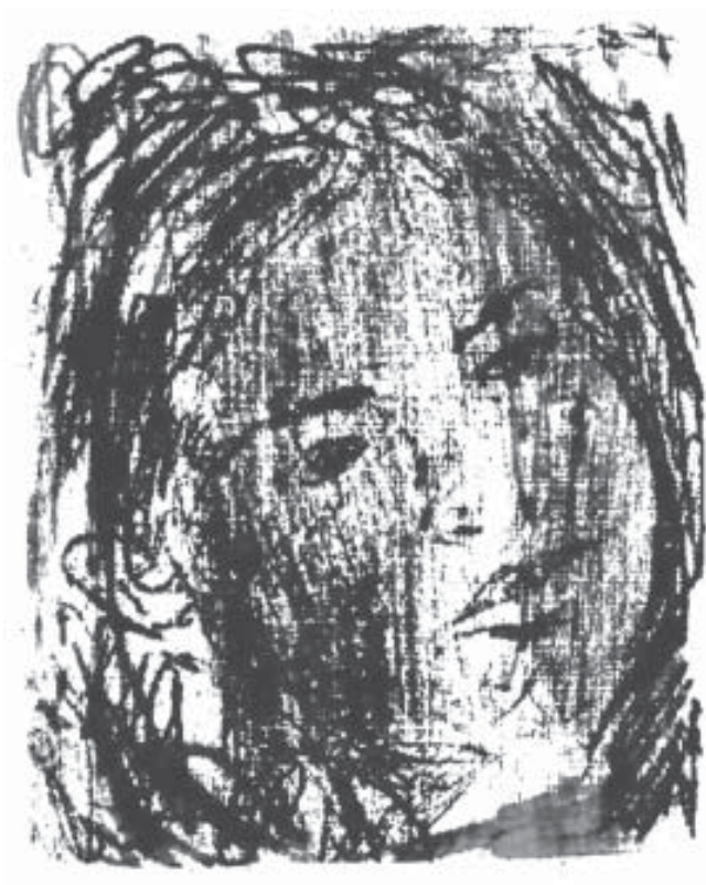
Sin título Monotipo (17,5 x 12,5 cm) 2005