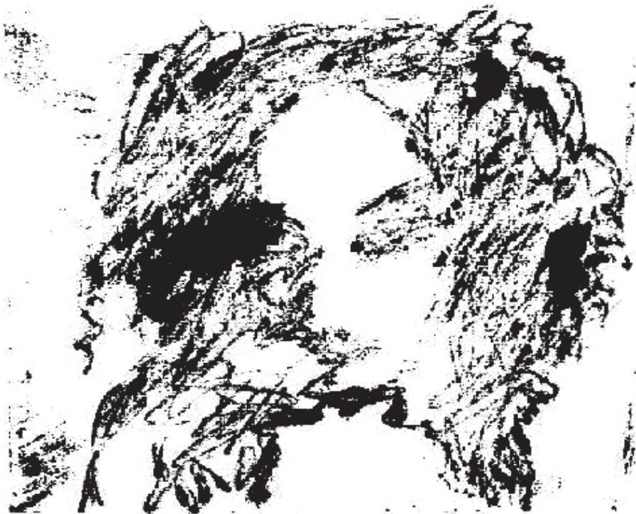
Naty Monotipo (9 x 13 cm) 2005