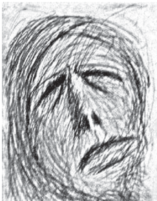
Sin título De la serie "Surgientes" Crayón sobre papel (7,5 x 5 cm) 2004