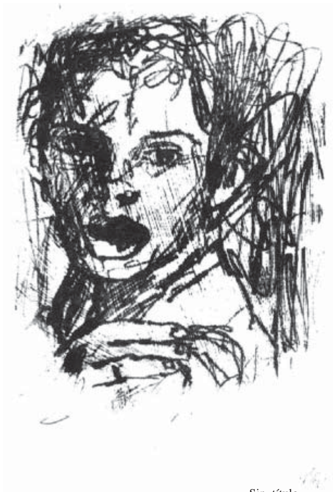
Sin título Monotipo (17,5 x 12,5 cm) 2005