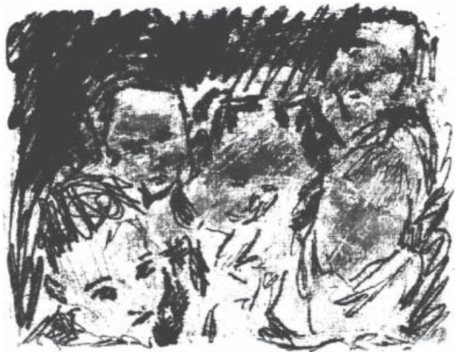
Los pequeños Monotipo (12,5 x 17,5 cm) 2005