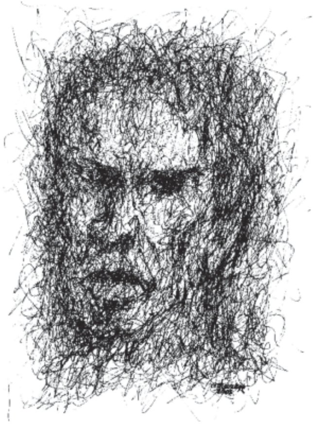
Sin título Lapicero sobre papel (21 x 15 cm) 2005