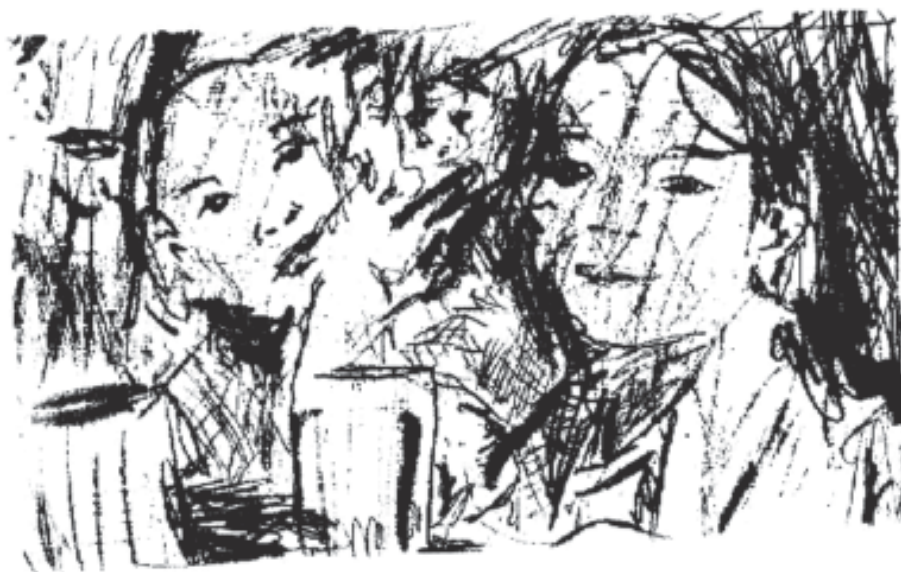
Sin título Monotipo (12 x 14 cm) 2005