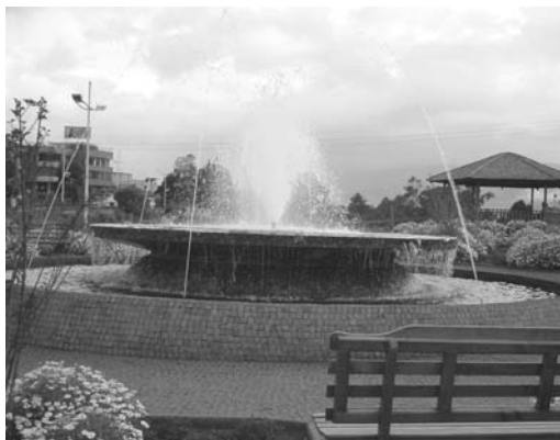
Parque lineal Machángara

Se refiere a la infraestructura y elementos tangibles. Debe contar con una fácil accesibilidad e iluminación. El diseño (tamaño, coherencia, ubicación) y la materialidad (elementos como árboles, asientos, faroles, ágoras, juegos infantiles, basureros) otorgan sentido y significado a los espacios, condicionan su uso y enriquecen el patrimonio arquitectónico y social de los barrios. Su diseño debe ir en correspondencia con los requisitos de las personas para un adecuado desarrollo de su vida social, ya que los espacios físicos no garantizan su uso de por sí.