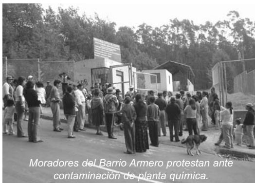
Moradores del Barrio Armero protestan ante contaminación de planta química.

El ciudadano está constantemente expuesto a distintos factores que ocasionan estrés (contaminación del aire, contaminación visual, ruido, entre otros). Es por eso que el espacio público debe constituirse como un canal de salida de estas preocupaciones constantes.