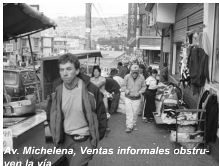
Av. Michelena, Ventas informales obstruyen la vía

Los vendedores formales e informales también han visto en el espacio público un sitio ideal para llegar a la gente con sus productos. Considerando el ancho reducido de muchas veredas por efecto de los cerramientos y las casetas de ventas, la ubicación de otros vendedores formales e informales obstruye aún más la circulación peatonal. El espacio debería estar distribuido de tal manera que tanto el peatón como el comerciante informal puedan ejercer sus derechos a la libre circulación y al trabajo, para una convivencia más armónica en la ciudad.