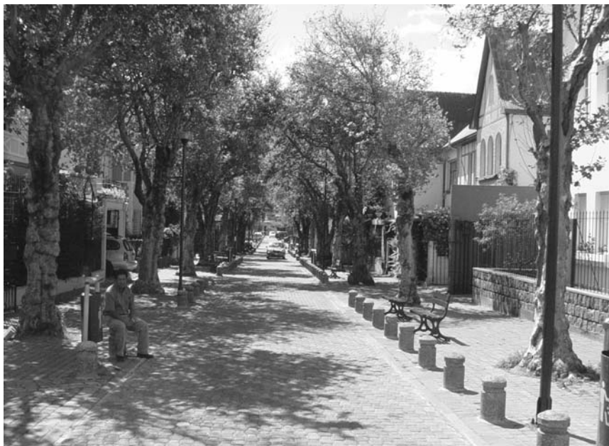
Calama y 6 de diciembre

Los elementos de este texto sobre espacio público son para la reflexión. Es importante que exista una política municipal sobre espacio público como algo prioritario, que establezca el marco político sobre el uso del espacio publico y poner freno al abuso del mismo.