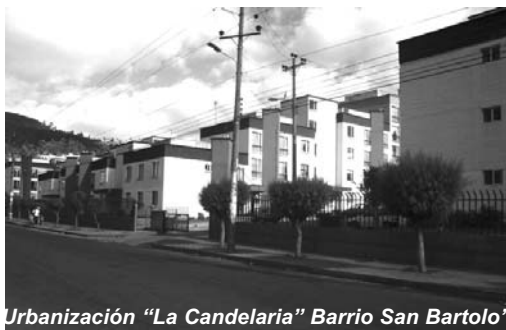
Urbanización “La Candelaria” Barrio San Bartolo

Por ello, consideramos que no son soluciones ni la privatización de los espacios, ni limitar la libre circulación. La mejor alternativa está en una recuperación real de espacios por parte de la comunidad, y dependencias municipales asumiendo el control de las situaciones mediante la ocupación de los espacios evitando su abandono. Estos lugares, en su planificación, deberán considerar iluminación adecuada, accesos amplios y vegetación que colabore con un mayor control visual.