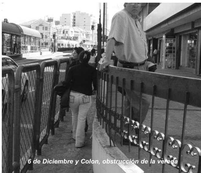
6 de Diciembre y Colon, obstrucción de la vereda

Las obstrucciones para la circulación peatonal también son causadas por los diseños municipales: muchas de las casetas de ventas, kioscos, se encuentran bloqueando la circulación peatonal, los cerramientos en las veredas para evitar los cruces en las esquinas también se convierten en sitios inseguros e incómodos para el libre tránsito de las personas, igual sucede con las paradas de buses acompañadas de rótulos de propaganda, los postes eléctricos, cámaras transformadoras de energía, entre otros elementos de equipamiento urbano.