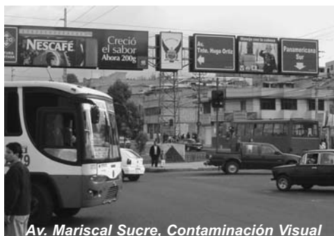
Av. Mariscal Sucre, Contaminación Visual

Otro elemento contaminante que por su proporción es necesario considerar es el cableado eléctrico, verdaderas ‘telarañas’ que además representan un peligro para la ciudadanía.