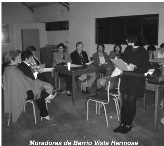
Moradores de Barrio Vista Hermosa

Por ello, las acciones en las que se busque la integración a la comunidad deben incluir la participación de estos “grandes” actores. Los niños son alejados cada vez más de los espacios donde pueden conocer otras personas y compartir juegos, espacios, sueños, imaginación. Si los parques son apropiados se convierten en espacios seguros donde los niños pueden aprender mucho más mediante la interrelación con otros como ellos.