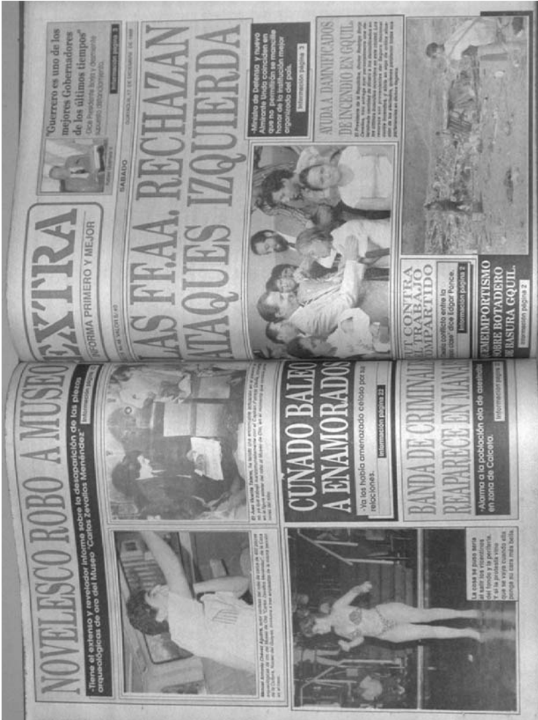
Contraportada del 16-XII-1988 y portada del 17-XII-1988