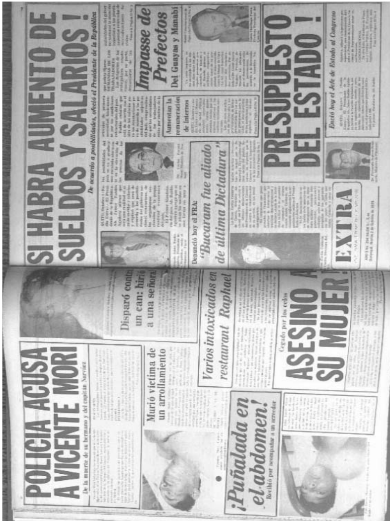
Contraportada del 1-X-1979 y portada del 2-X-1979