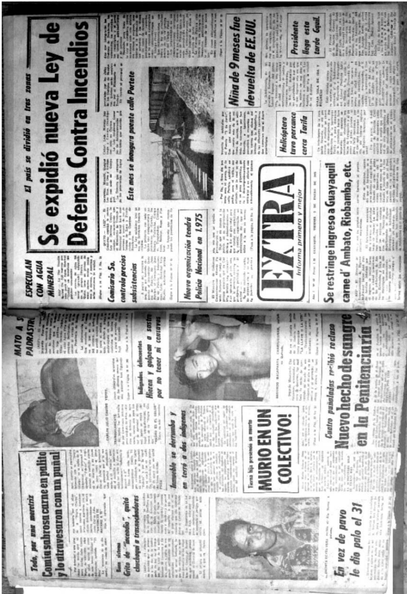
Contraportada del 2-1-1975 y portada del 3-1-1975