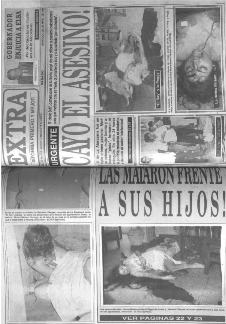
Contraportada del 21-IV-1989 y portada del 22-IV-1989