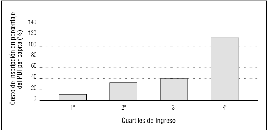
Gráfico 2 Costo de inscripción en el registro de empresas

No hay una única estructura institucional que garantice el crecimiento económico y la reducción de la pobreza. El desafío que enfrentan las autoridades es orientar la evolución institucional de tal manera que estas favorezcan el desarrollo económico.