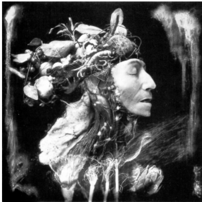
Joel Peter Witkin (1984)

Como se indica al final de la publicación: ...Aunque la administración Clinton liberó miles de documentos secretos relacionados con el conflicto guatemalteco, incluyendo el