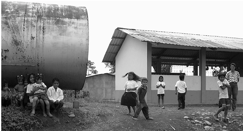
© Comité de Derechos Humanos de Orellana, Red de Líderes Comunitarios Angel Shingre y Oficina de Pastoral Social del Vicariato de Aguarico

dito, y constituye el mayor porcentaje de las inversiones del estado, incrementando año a año la dependencia del país y la deuda externa.