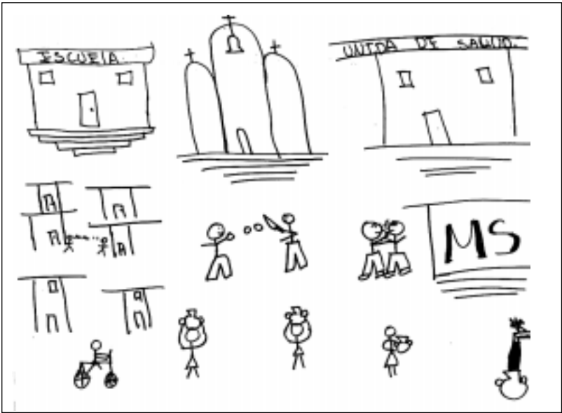
Ilustración 4.1. Dibujo de joven de comunidad: Cómo es mi comunidad

cuencia es que muchos viven con temores de volverse víctimas de varias formas de violencia y en diferentes ámbitos. En los grupos de enfoque con los jóvenes, ellos mencionaron como preocupaciones principales: ser víctimas de la violencia doméstica, de las pandillas, y por parte de los vecinos. Las jóvenes mujeres expresaron sus preocupaciones por las violaciones, siendo ese su principal temor. La casa al igual que la calle y los pasajes pueden ser lugares peligrosos para ellos. Los dibujos mostrados a continuación fueron hechos por una joven de una de las comunidades, en uno de los talleres realizados. El primero refleja cómo es su comunidad ahora; la segunda es cómo quisiera que fuera en el futuro. Dichas imágenes muestran la forma en que el hacinamiento, la falta de recursos básicos (agua), y la no-existencia de espacios recreativos, interactúan con la violencia. En el segundo, la joven ha dibujado viviendas más grandes y espaciadas, libres de señales de pandillas; una cancha para la recreación de los jóvenes, quienes antes aparecían peleando con cuchillos; y la manera en que los vecinos colaboran, ayudándose a cargar agua de la cantarera. Estas representaciones de la comunidad, la violencia y la exclusión vistas a través de los ojos de esa joven, nos cuentan mucho sobre las convivencias.