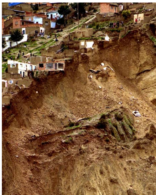
Deslizamiento en Alto Tacagua, 2001.

Luego Cannon introduce algunas modificaciones al modelo y lo estructura de la siguiente manera en su documento Análisis de Vulnerabilidad, medios de vida y desastres (Cannon, 2006) establece que la vulnerabilidad debería ser capaz de prevenir desastres, así como las intervenciones más amplias de desarrollo pueden reducir la vulnerabilidad y la pobreza al mismo tiempo. Eso se debe hacer buscando formas de proteger y mejorar los medios de vida de la población ayudando a la población vulnerable a protegerse y apoyando a las instituciones en su trabajo de prevención de desastres, añade también que con el AV se pueden identificar las causas de origen o factores institucionales (procesos políticos, económicos y sociales mas generales) que podrían estar vinculados a los componentes: