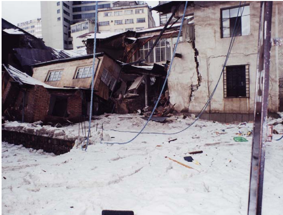
Granizada del 19 de Febrero 2001.

calcular el estallido de un volcán), por lo tanto se debería dar un mayor énfasis a los científicos que están a cargo de poder medir o determinar la ocurrencia de un fenómeno físico adverso y quiénes mejor que los que estudian la ciencia de la tierra o sea los geólogos, como ejemplo. Pero además indican que si va a venir el evento, hay que preparar a la población para salvarla, rescatarla o atender una vez que se ha producido el desastre o la emergencia, por lo tanto hay que tener buenos sistemas de atención (en especial las Defensas Civiles, Protección Civil, etc.). Esta es una mirada solo a las amenazas.