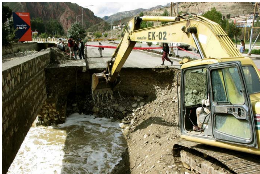
Sifonamiento en la avenida Costanera.

Una vez producido el desastre, lo que se hace y no de manera coordinada ni efectiva, menos eficiente, es atender a la emergencia, esta atención se traduce en evacuación de la gente a campamentos o a improvisadas carpas, dotación de alimentos y agua, además del control de enfermedades, y si el problema es muy visible, los reubican en lugares totalmente alejados, fuera de sus actividades económicas y sociales, lo que a corto plazo hace que retornen a los lugares del desastre.