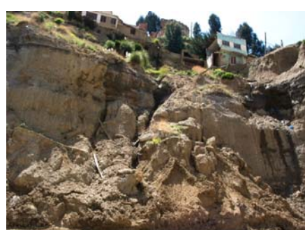
Desastres en la ciudad de La Paz.