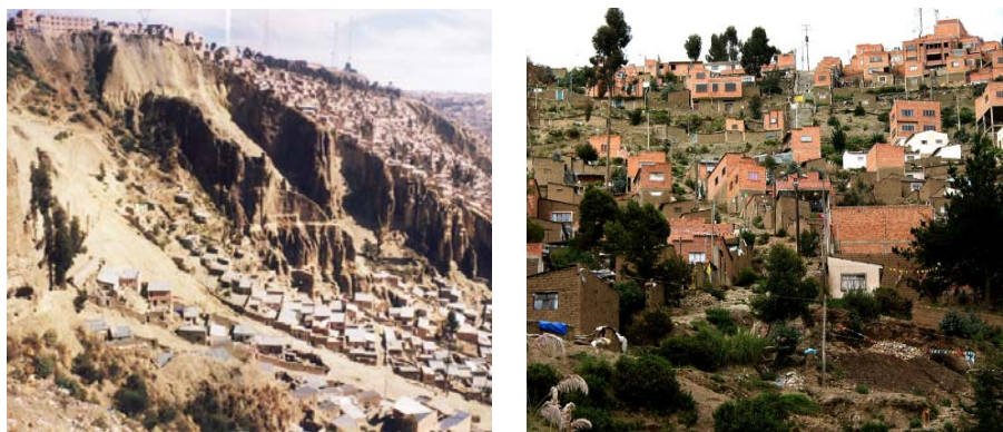
Vistas de las laderas 1 de la ciudad de La Paz.