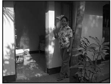
Empresaria de Somoto (Madriz).