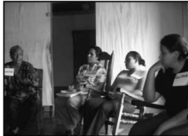
Grupo focal con mujeres emprendedoras de Somoto.