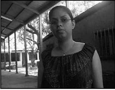
Encuestadora y auxiliar en un grupo focal.