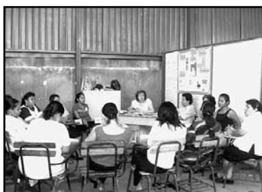
Escenas de un grupo focal realizado con mujeres del área urbana de Managua.