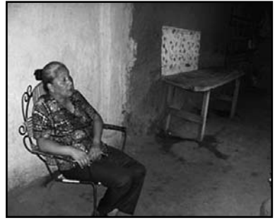
Líder de las empresarias de Somoto.