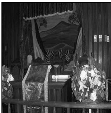
Espacios interiores y exteriores de la iglesia bautista ubicada en el Barrio San Judas de Managua, a la que pertenece un grupo de participantes.