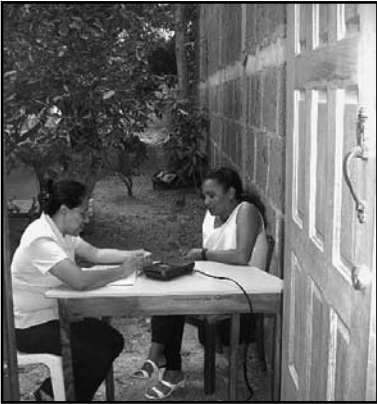
Facilitadora del Proyecto con las campesinas de La Tunozza, Estelí.