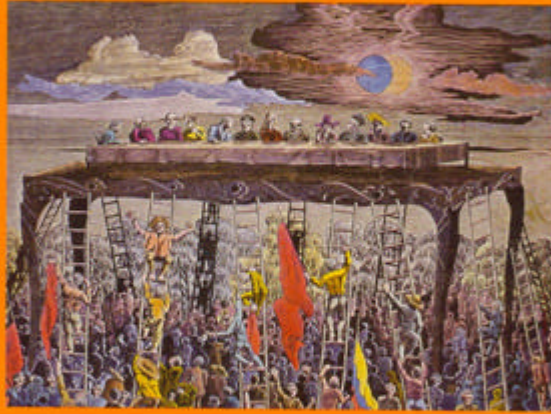
Alfonso Quijano "La última cena" Xilografía 67 x 97 cms. 1971