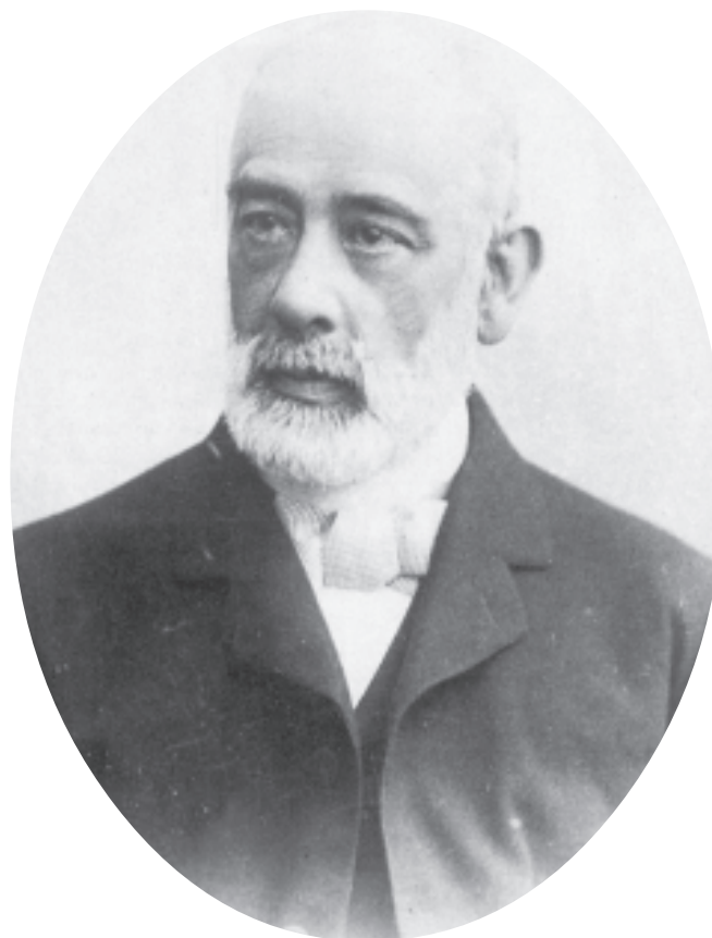
Santiago Pérez (1830-1900).