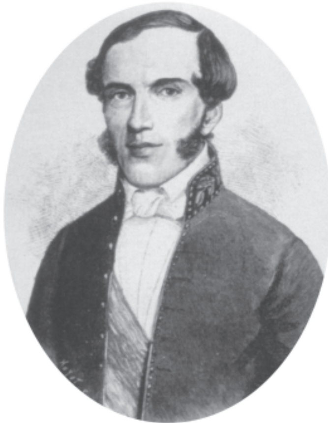
Rufino José Cuervo (1801-1853). Gran Enciclopedia de Colombia. Literatura t. 1, Círculo de Lectores, Bogotá, 2007

A manera de introducción, presento en este apartado algunos planteamientos que me permiten acercarme al concepto de trabajo y al carácter que éste asume en el capitalismo tardío.