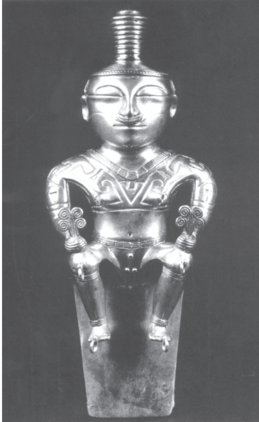
Tesoro de los Quimbayas, hallado en 1881 y salvado de ser fundido en Medellín. Museo de América, Madrid (Gran Enciclopedia de Colombia. Círculo de Lectores)