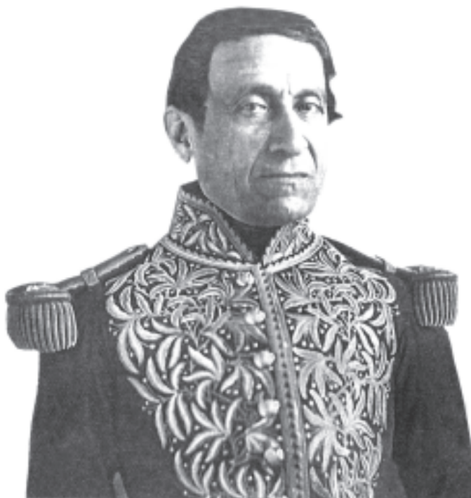
José María Melo (1800-1860) se tomó el poder por un día y lo defendió 240. Desterrado, junto con doscientos artesanos, murió asesinado en Chiapas defendiendo como general el gobierno de Benito Juárez