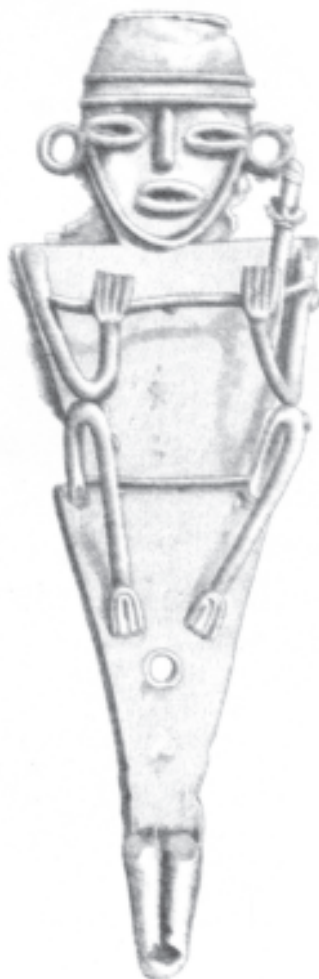
Dibujo de Ezequiel Uricoechea para su libro Memorias sobre las antigüedades neo-granadinas , 1854

tución quedara supeditada a los dictados de la competencia económica, de la valorización de recursos y de la mercantilización de servicios. Para responder a su inquietud tendría que remontarse al estudio de los procesos a los que nosotros, los ciudadanos