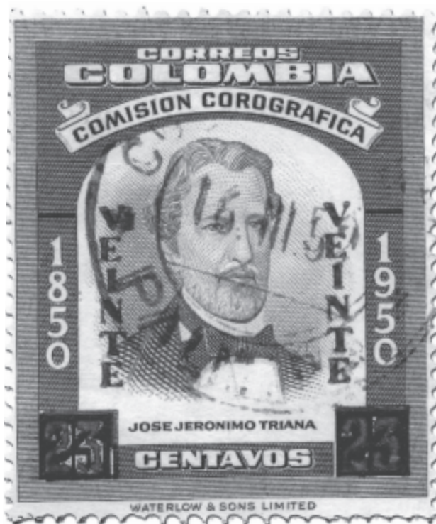
Estampilla de la República de Colombia

de con las variadas exigencias de formación de jóvenes y adultos y “las dinámicas de expansión, diferenciación y especialización del conocimiento avanzado, en torno al cual se tejen las redes productivas, tecnológicas, de comercio y políticas de la sociedad global” (Brunner, 2005: s/p); d) diferenciarse institucionalmente de tal forma que permita “la división y organización cada vez más especializadas del trabajo de producción, transmisión y transferencia del conocimiento avanzado” ( Ibíd. : s/p); e) ser evaluada externamente por parte de los pares académicos y los miembros gubernamentales y del sector productivo con el fin de garantizar “la calidad de sus procesos y productos, la efectividad de sus resultados y la eficiencia de su operación al tiempo que se busca elevar su transparencia y responsabilidad frente a diversos actores interesados” ( Ibíd. : s/p); f) aumentar la relevancia y pertinencia de sus funciones, lo que implica “incrementar su contribución a la profesionalización y tecnificación de la economía, alinearse con las cambiantes demandas del mercado laboral y participar en la frontera del conocimiento y alimentar el continuo proceso de reflexión y análisis mediante las cuales las sociedades modernas conducen sus asuntos públicos” ( Ibíd. : s/p); g) ampliar y diversificar sus fuentes de financiamiento de tal forma que se atiendan las demandas anteriores y los costos crecientes que generan la “masificación de la matrícula, las exigencias de calidad y pertinencia,