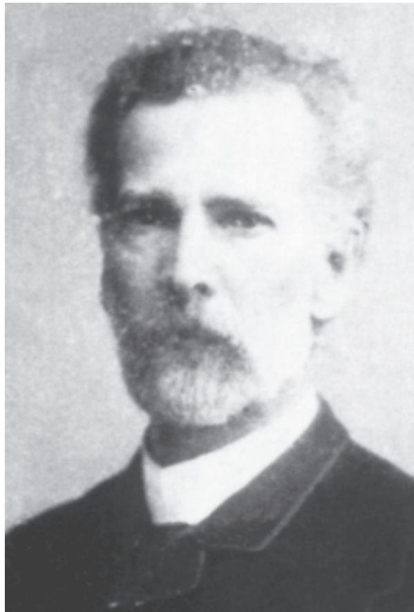
José María Samper (1828-1888). Gran Enciclopedia de Colombia. Literatura t. 1, Círculo de Lectores, Bogotá, 2007

moderno/colonial, a saber, el modelo napoleónico de escuelas profesionales y el modelo humboldtiano-alemán de universidad de investigación. En cuarto lugar, cabe la pregunta ¿cuál sería el modelo de educación superior que resultaría más apropiado para Colombia en el proceso de inserción en un sistema-mundo cada