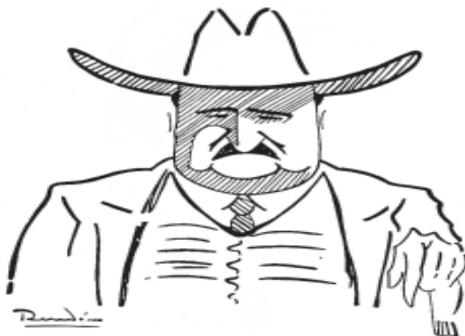
Tomás Carrasquilla (1858-1940). Dibujo de Ricardo Rendón

Pero la sociedad contemporánea ha sufrido transformaciones pro-