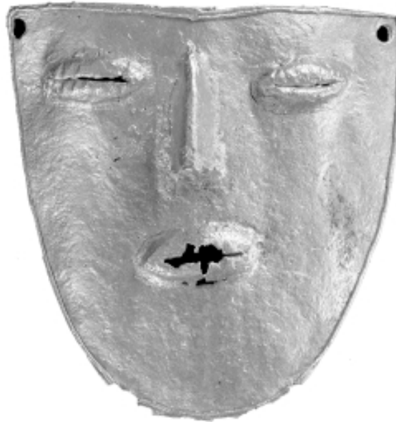
Cultura Muisca. Máscara en oro de 5,3 cm de alto. 400 d. C. - 1800 d. C. Colección Museo del Oro. Banco de la República.

parar terrenos sobre los que pueden construir estructuras. Y aunque los residentes no son “dueños” de la propiedad, pueden obtener derechos de propiedad intelectual sobre las estructuras que construyen y pueden venderlas en el mercado. Actualmente se manejan aproximadamente 241.000 dólares en transacciones diarias de moneda virtual “Linden dollars”.