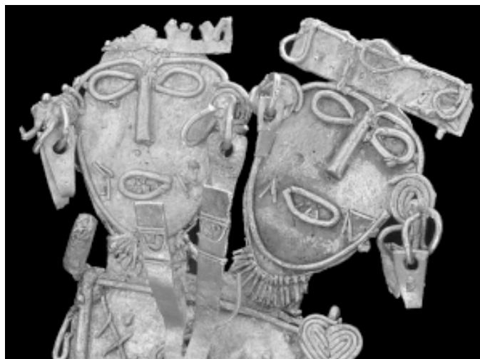
Cultura Muisca. Figura votiva en oro de 9 cm de alto (detalle). 600 d. C. - 1800 d. C. Colección Museo del Oro. Banco de la República.

Una forma de comprender las ideas que capturan la imaginación de la cultura es el estudio de la manipulación de ciertos objetos que las