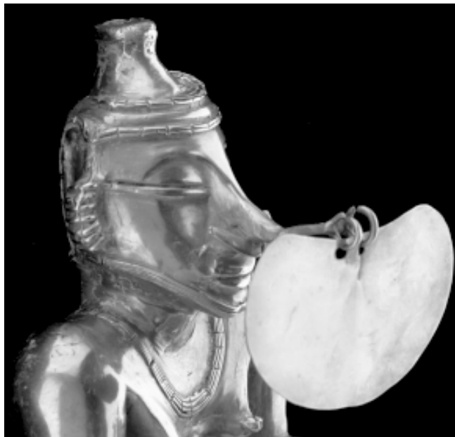
Cultura Quimbaya. Recipiente para cal en oro de 27 cm de alto. 400 a. C. - 400 d. C. Colección Museo del Oro. Banco de la República.

características del mundo de la red dan pie a una amplia gama de representaciones y juegos de rol, engaños, medias verdades y exageraciones, sobre todo porque el anonimato y la ausencia de señales visuales y auditivas lo permiten y, al mismo tiempo, nos aíslan de las consecuencias. Y aunque, en el fondo, en la red no somos tan anónimos, la distancia física y la poca presencia social hacen que nos sintamos menos inhibidos, más a salvo de ser descubiertos y un